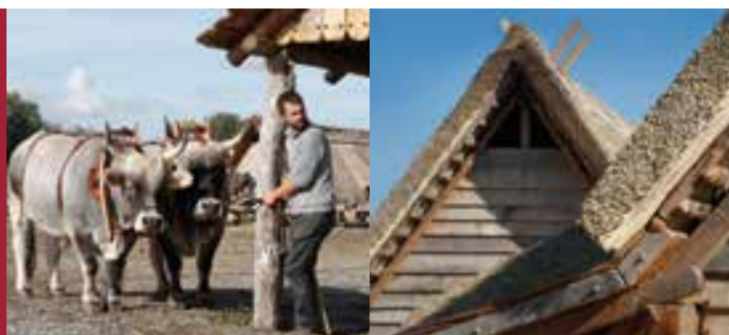
Karolingisches Freilichtlabor Lauresham

Im Besucherzentrum BIZ hat die Museumspädagogik samt Mittelalterküche ihren Sitz. Neben dem Ticketverkauf und einem Museumsshop ist hier der Startpunkt für die Lauresham-Führungen.