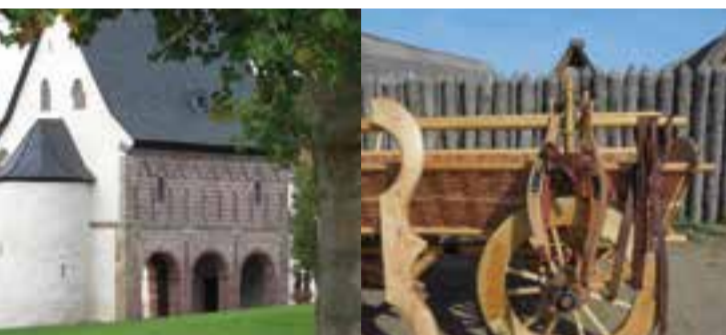
Königshalle (UNESCO Welterbe) Karolingisches Freilichtlabor Lauresham