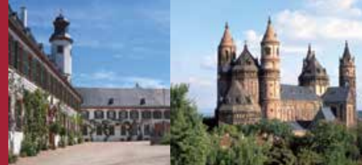
Benediktinerabtei Seligenstadt Dom St. Peter, Worms