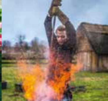
Im Freilichtlabor Lauresham