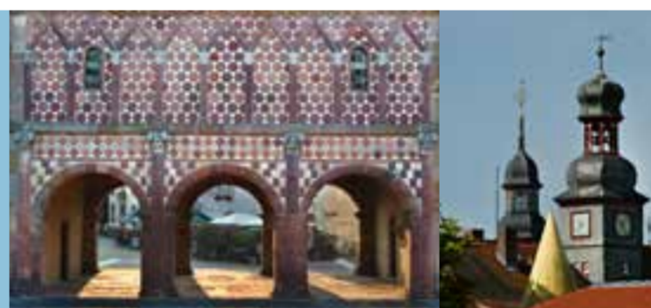
Fassade der karolingischen Königshalle | Über den Dächern