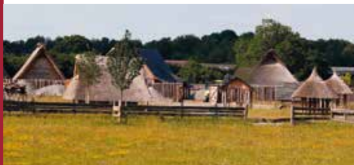
Karolingisches Freilichtlabor Lauresham

Wo einst die Tabakblätter trockneten, befindet sich heute das Museum des Tabakanbaus.