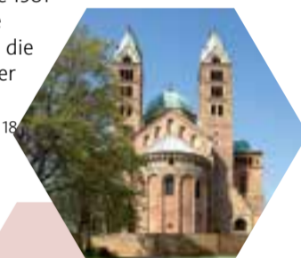
Kaiserdom zu Speyer

INFO Speyer | Domplatz | Tel. 0 62 32/10 21 18 | www.bistum-speyer.de