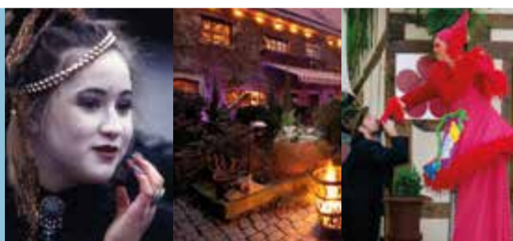
Principessa | Willkommen im Theater Sapperlot