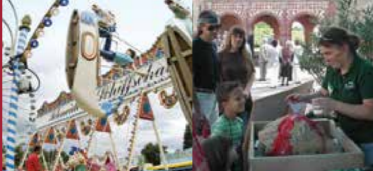
Auf dem Johannisfest Forschen beim UNESCO Geo-Naturpark

Mit dem UNESCO Geo-Naturpark Bergstraße-Odenwald ist eine weitere, der UNESCO angegliederte Institution in Lorsch zu Hause. Auch die Geschäftsstelle der Kreisvolkshochschule befindet sich hier. Das vielfältige Kulturleben schließt städtische Feste, Vereinsaktivitäten und Kulturprojekte ebenso ein, wie eine Institution, die weit über die Region hinaus für Aufmerksamkeit sorgt: die Kleinkunsthöhle Sapperlot.