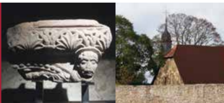
Im Schaudepot Zehntscheune Blick über die Klostermauer