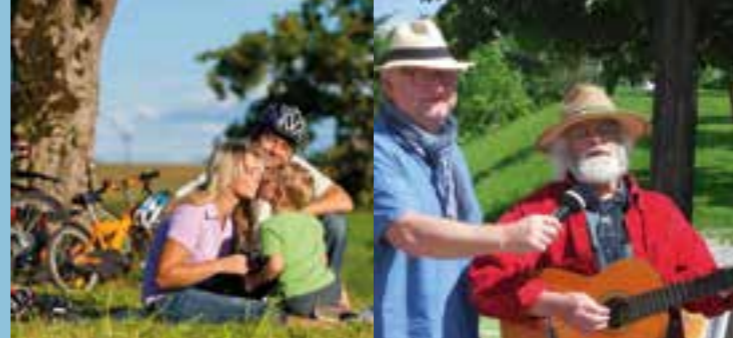
Radl-Paradies: das südhessische Ried

INFO Tourist-Information NibelungenLand im Alten Rathaus info@nibelungenland.info | Tel. 0 62 51/17 526-0