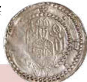
Lorscher Silberpfennig, 2. Hälfte 12.Jh.

Umfangreiche Überarbeitungen haben das Areal des UNESCO Welterbes erweitert und ergänzt. Damit wurden die Anschaulichkeit und Erlebbarkeit entscheidend gesteigert. Das am Flüsschen Weschnitz gelegene Kloster Altenmünster und das Klostergelände in der Stadtmitte verbindet nun ein etwa 2,5 km langer Rundweg. Höhepunkt ist der Klosterhügel mit Königshalle, Kirchenfragment, Klostermauer und dem neu angelegten Kräutergarten. Hinzu kommt das Schaudepot Zehntscheune sowie das Museumszentrum, in dem die bau- und geistesgeschichtliche Bedeutung des Ortes greifbar wird. Einzigartig in Europa ist der neu errichtete karolingische Herrenhof Lauresham, wo das Thema der Grundherrschaft im Frühmittelalter lebendig und anschaulich präsentiert wird.