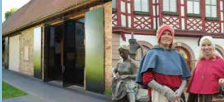
Schaudepot Zehntscheune | Historische Stadtführung