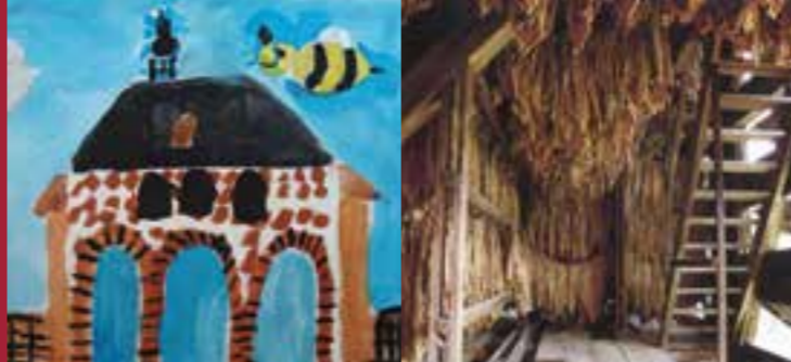
„Lorscher Bienensegen“ von Katrin Jochem Blick in eine Tabakscheune