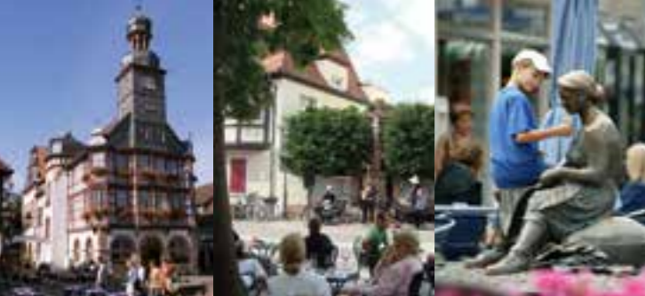
Historisches Rathaus Platzkonzert Am Tabakbrunnen